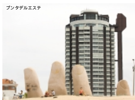
フンタデルエステ

英領バージン諸島最大の島、トルトラ島の首都です。古くは砂糖貿易の中心として栄えましたが、現在は恵まれた自然を活かした観光業が中心の美しい島です。