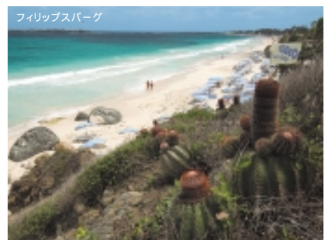
フィリップスバーグ