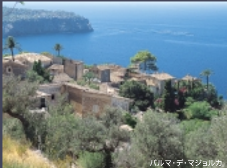
バルマ・デ・マジョルカ