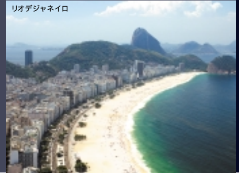
リオデジャネイロ