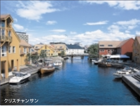
クリスチャンサン