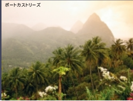
ポートカストリーズ